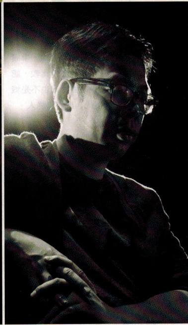
(中) Yan Tsui作品：志，你知道嗎？如果可以選擇的話，我也不想這樣。（節錄）