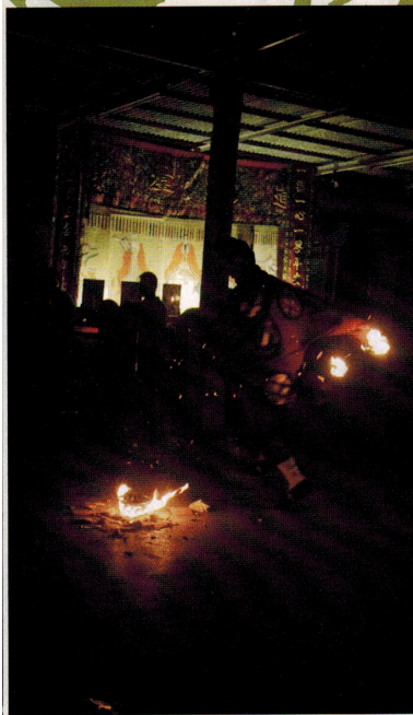
(左) Shek Chun Yin作品：台下的觀眾向我微笑，他們在等待我的演出。老婆婆從側門走進來，不知道她還有座位嗎？今晚，全院滿座。