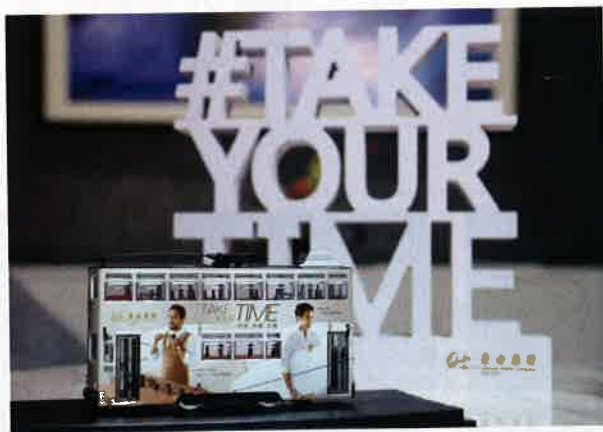
正因這輛印有東方表行廣告的電車，促成表行與浪人劇場的合作關係。