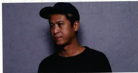
填詞人小克形容「時間」是讓人體驗人世間七情六慾的工具。