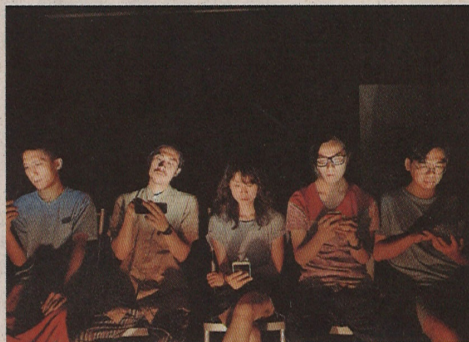
在這個機不離手的年代，人與人如何連結是劇作關注的重心。