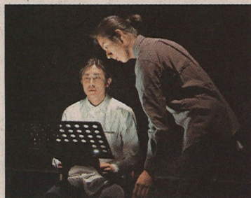
故事從男主角突然失卻與女友的聯繫開始。

全劇採用意識流及第二身人稱「你」去寫，讓敘事者與主角互動，希望讓觀眾有聆聽觀察自己故事的感覺。演出在細小親密的空間裏進行，希望能讓觀眾也一同參與其中，猶如進行Facebook live一樣。「上網是一個向內聚焦的活動，只是坐着，因此我們在自己改建的一個表演空間做，讓舞台與觀眾的距離很短。」