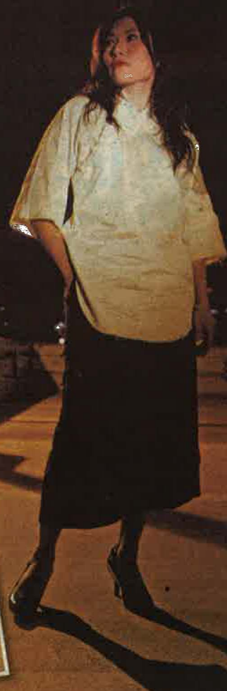
《つづく、李香蘭》一劇戲中主角唐若冰的造型照。