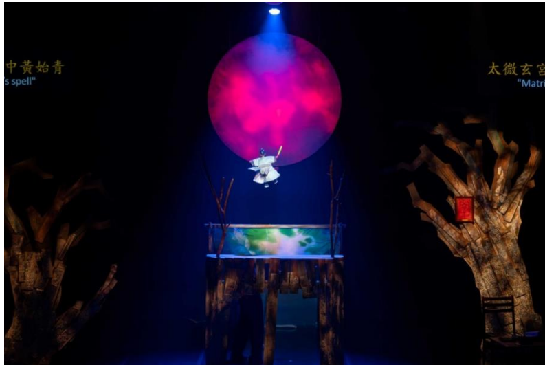
圖 5 布袋戲 | 《千年幻戀》先後於去年 11 月在台中歌劇院「巨人系列」、今年 7 月於台灣戲曲中心「夏日生活週」上演，終在今年 9 月躍上香港舞台。