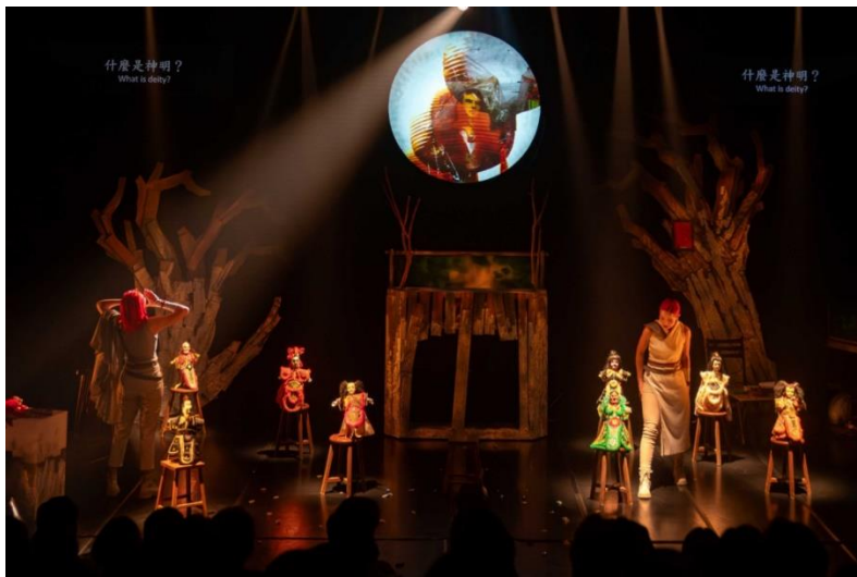
圖 4 布袋戲 | 台灣傳統布袋戲將在香港劇場呈現。圖為台北演出。